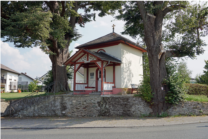
Kapelle Oberheiligenhaus, Villmarer Lahn-Marmor-Weg; Rundweg 2 (2019)