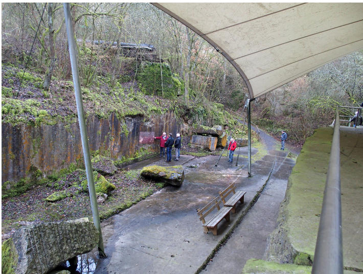
Unica-Bruch in Villmar (2018)