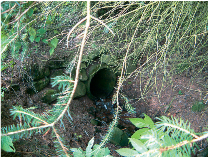
Ein in den Boden eingelassenes und mit Bruchsteinen eingefasstes Rohr leitet den Prether Bach weiter (2005).