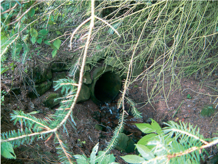
Ein in den Boden eingelassenes und mit Bruchsteinen eingefasstes Rohr leitet den Preter Bach weiter (2005).