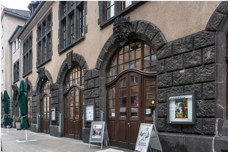
Blick auf die Außenfassade der Feuerwache an der Vondelstraße im Kölner Süden (2018).