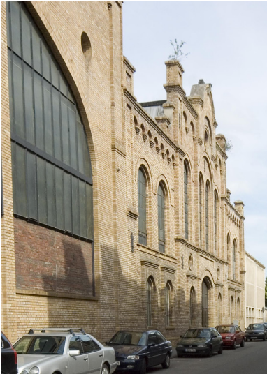
Kalker Werkzeugmaschinen-Fabrik von Breuer, Schumacher & Cie (2018)