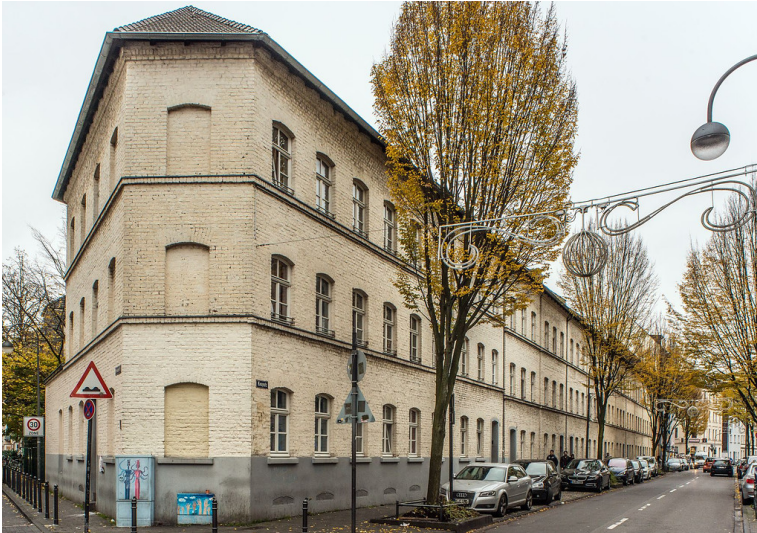
Felten & Guillaume Werkssiedlung in Köln-Mülheim (2018)