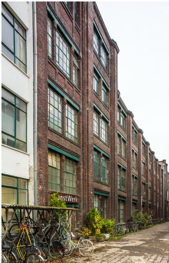
Gummifädenfabrik Kohlstadt in Mülheim (2018)