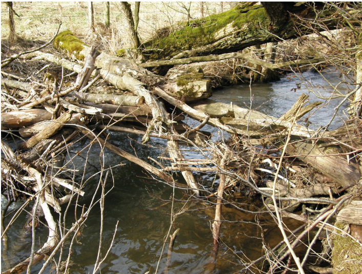
Blick auf Totholzablagung über dem Liersbach im Sommer (2010).