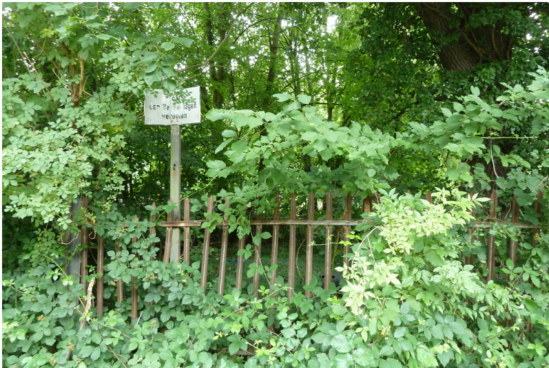
Reste vom Zaun des Geländes der alten Petersbergbahn (2021) mit noch erhaltenem Schild "betreten der Bahnanlagen verboten".