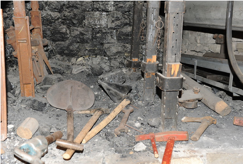
Blick in den Barbarastollen, unterirdisches Schaubergwerk im Keller der Universität zu Köln (2011).