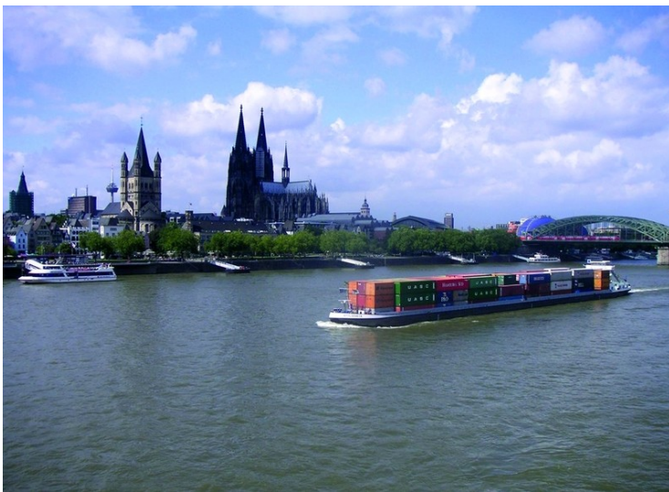
Blick auf den Rhein und die Kölner Altstadt mit dem Kölner Dom und der Hohenzollernbrücke. Im Vordergrund fährt ein voll beladenes Containerschiff flussaufwärts (2004)

Bundesland: Nordrhein-Westfalen, Rheinland-Pfalz