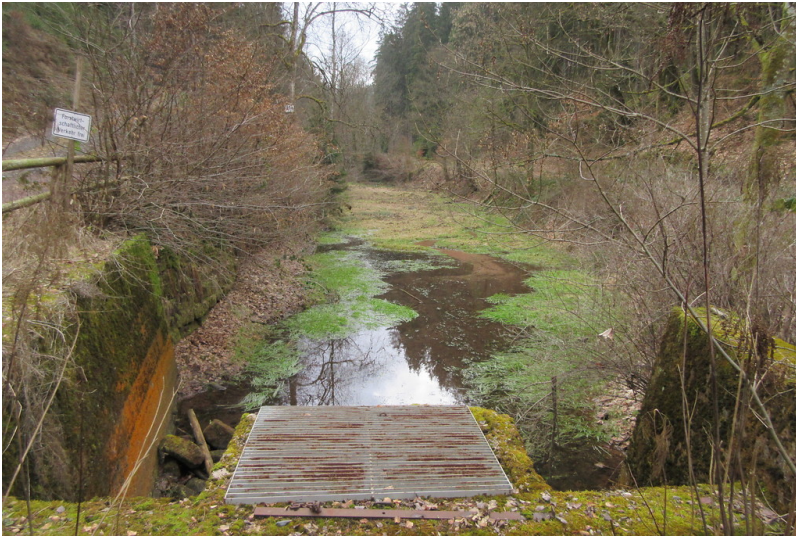
Teilgefülltes Woogbecken mit dem mäandrierenden Erlenbach