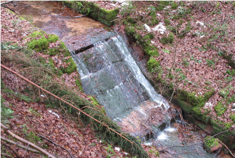
Oberste Sohlrampe