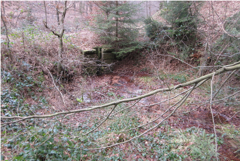
Woogbecken mit dem Mönchbauwerk im Hintergrund