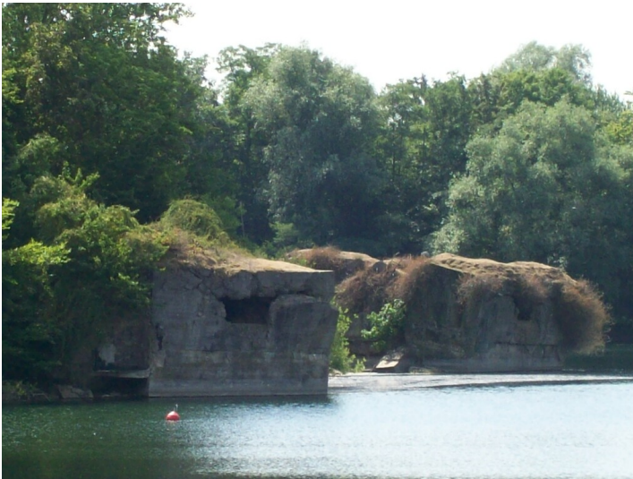
Biotopverbund Westwall - Der Adolfosee (2017)