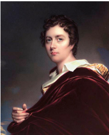
Porträt des englischen Dichters Lord Byron (George Gordon Noel Byron, 6th Baron Byron, 1788-1824) von Henry Pierce Bone (1837).