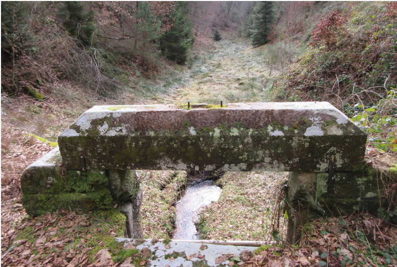
Absperr- und Auslaufbauwerk