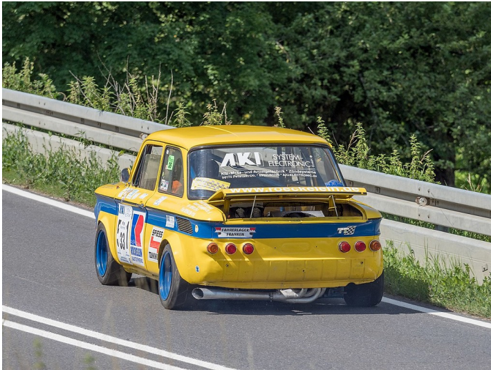
Ein als Fahrzeug für Bergrennen modifizierter NSU TT beim Bergrennen von Würgau im oberfränkischen Landkreis Bamberg (2017).