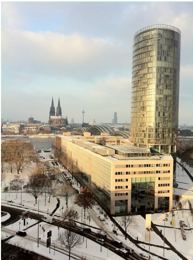
Winterlicher Blick auf den KölnTriangle und das LVR-Horion-Haus in Köln-Deutz im Vordergrund sowie die Kölner Stadtsilhouette mit Dom und "Colonus" im Hintergrund (2010)