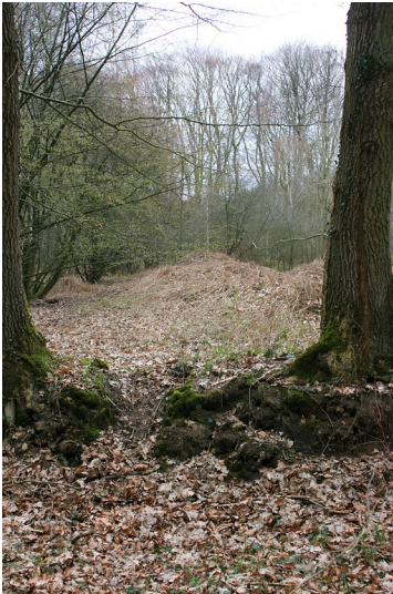
Großsteingrab "Langbett Albersdorf 50" im Steinzeitpark Dithmarschen (2019)