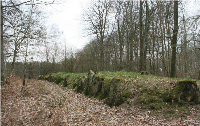
Großsteingrab "Langbett Albersdorf 48" im Steinzeitpark Dithmarschen (2019)