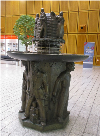
Der Kölnisch-Wasser-Brunnen in der Schalterhalle der Kreissparkasse am Neumarkt in Köln-Altstadt-Süd (2019)