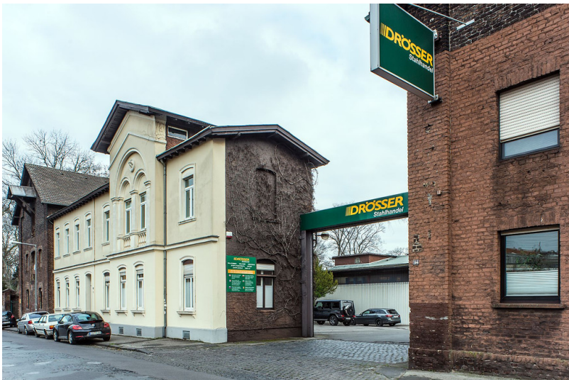
Stahlhandel Drösser (2018)