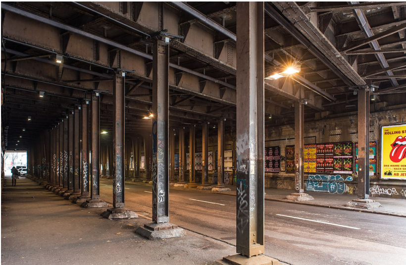
Brücke der Kölner Ringbahn an der Maybachstraße (2018)