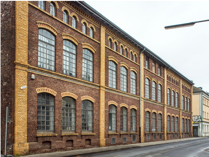
Accumulatorenfabrik Gottfried Hagen (2018)