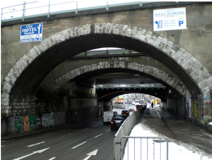
Brücke der Kölner Ringbahn an der Gladbacher Straße (2018)