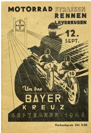
Titelseite des Programmhefts für das Motorrad-Rennen "Um das Bayerkreuz" am 12. September 1948 bei Leverkusen.