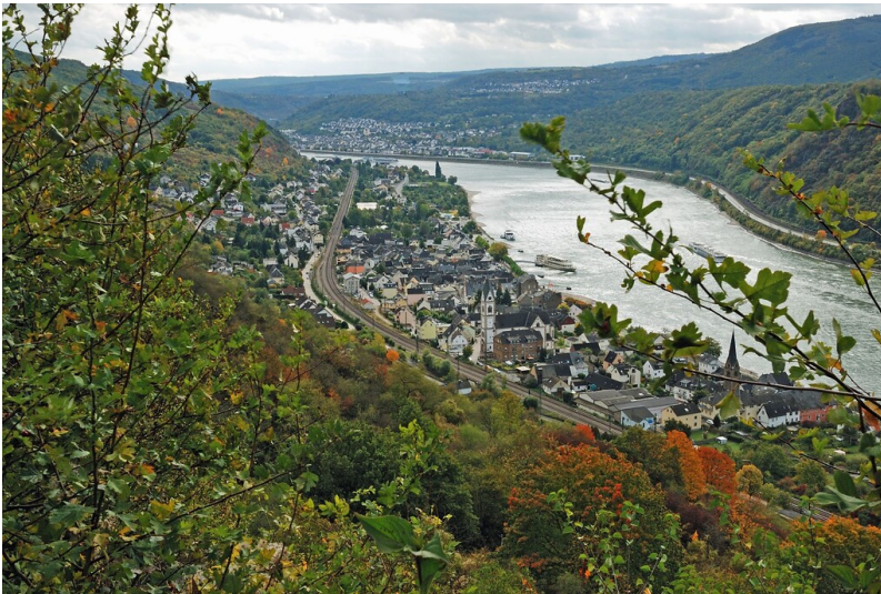
Blick auf die Ortsgemeinde Kamp-Bornhofen am Rhein mit dem Kloster Bornhofen (2012)