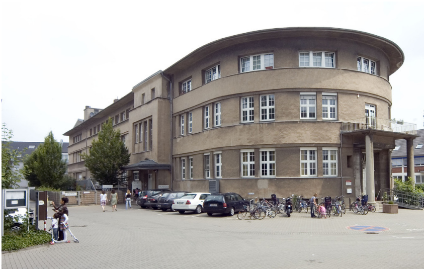
Opekta (2018)