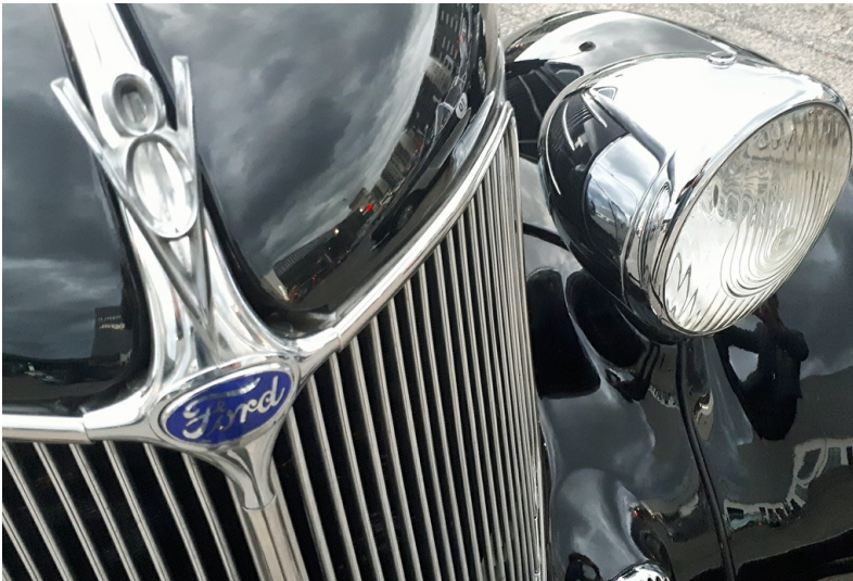
Das vor der NS-Zeit und dann wieder ab 1968 verwendete Emblem der "Ford-Pflaume" an der Front eines zwischen 1932 und 1940 produzierten Ford V8 (2019).