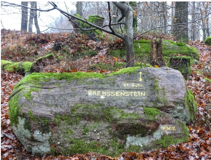
Ritterstein Nr. 80 Preussenstein 21 Schr. südwestlich vom Eschkopfturm