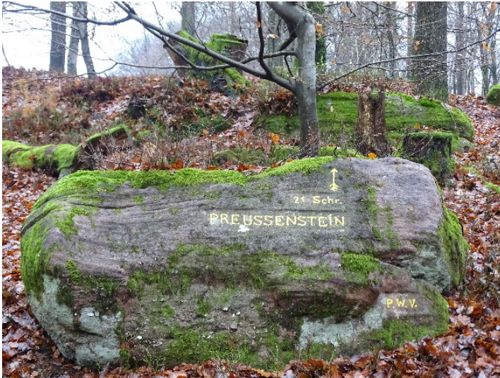
Ritterstein Nr. 80 Preussenstein 21 Schr. südwestlich vom Eschkopfturm