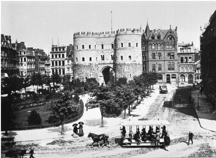
Historische Aufnahme der Kölner Hahnenortburg am Rudolfplatz, davor ein Wagen der Kölner Pferdebahn (um 1890).