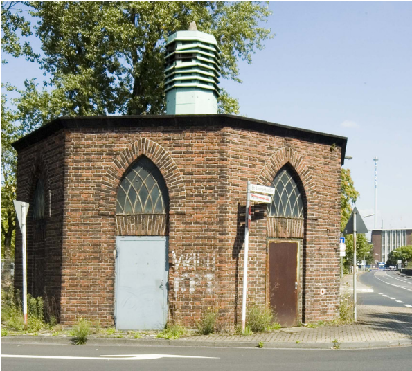
Transformatorstation in Köln-Niehl (2018)