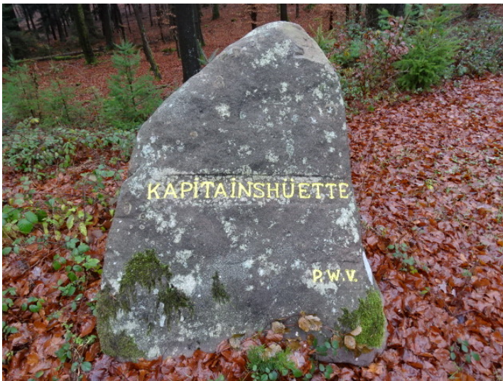
Ritterstein Nr. 79 Kapitainshütte südwestlich vom Eschkopfturm