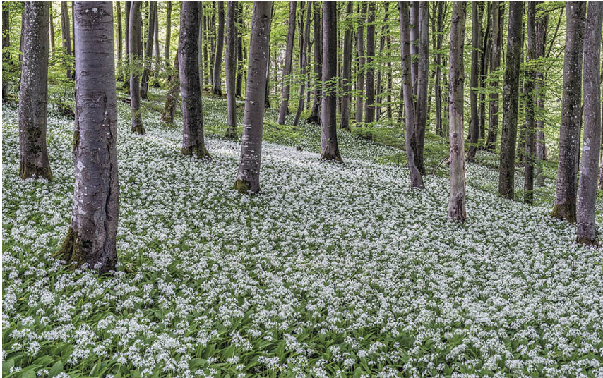
Bärlauchblüte in der Schönecker Schweiz (2019)