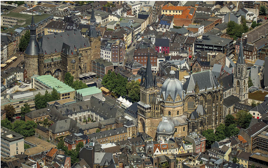
Der Katschhof in Aachen (2018)