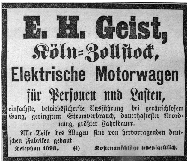
Zeitungsanzeige der Firma "E. H. Geist, Köln-Zollstock" von 1899, geworben wird für "Elektrische Motorwagen für Personen und Lasten".