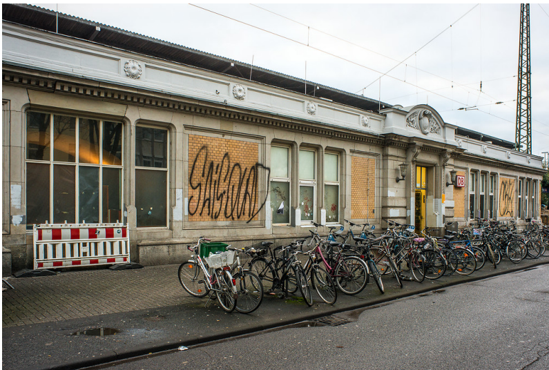
Bahnhof Köln-West (2018)