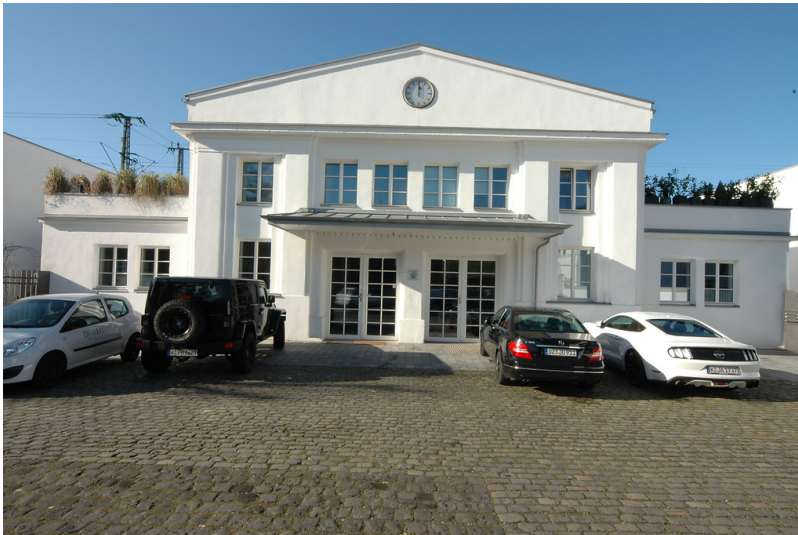
Bahnhof Köln-Nippes (2018)