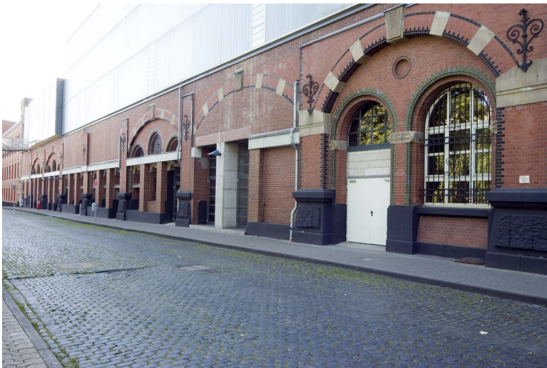
Postbahnhof Gladbacher Wall (2018)