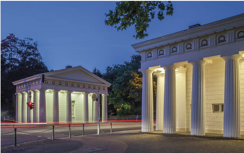
Ratinger Tor Düsseldorf (2019)