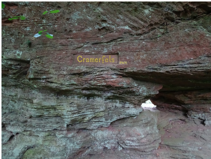
Ritterstein Nr. 100 Cramerfels beim Forsthaus Helmbach (2018)