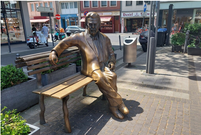
Bronzedenkmal des Kölner Volksschauspielers Willy Millowitsch (1909-1999) auf dem nach ihm benannten Willy-Millowitsch-Platz in Köln-Alttadt-Nord (2021).