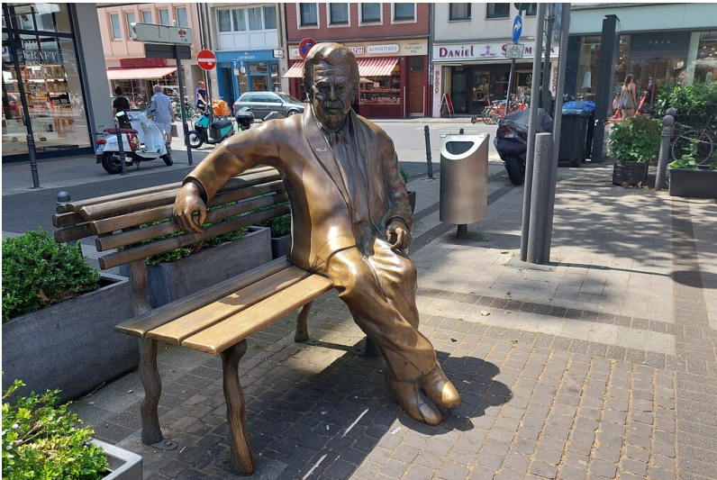
Bronzedenkmal des Kölner Volksschauspielers Willy Millowitsch (1909-1999) auf dem nach ihm benannten Willy-Millowitsch-Platz in Köln-Altstadt-Nord (2021).