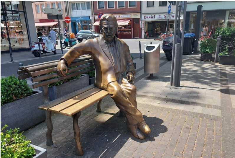
Bronzedenkmal des Kölner Volksschauspielers Willy Millowitsch (1909-1999) auf dem nach ihm benannten Willy-Millowitsch-Platz in Köln-Altstadt-Nord (2021).