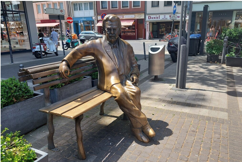
Bronzedenkmal des Kölner Volksschauspielers Willy Millowitsch (1909-1999) auf dem nach ihm benannten Willy-Millowitsch-Platz in Köln-Altstadt-Nord (2021).