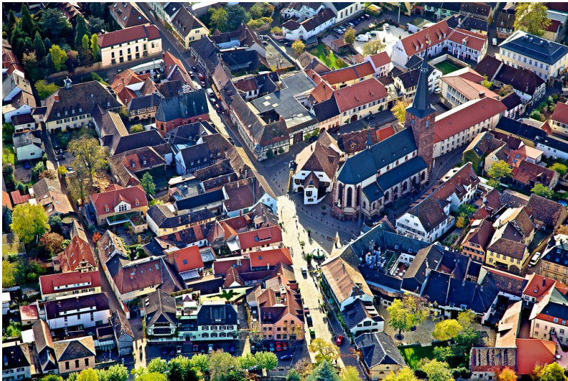
Luftaufnahme von Deidesheim (2010)