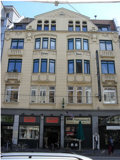
Das 1905 erbaute "Colonia Haus" in der Aachener Straße am Kölner Rudolfplatz, bis 2018 Spielstätte des "Millowitsch-Theaters" (2013)