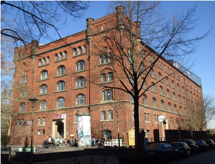
Ansicht des Bürgerzentrums "Bürgerhaus Stollwerck" in Köln-Altstadt-Süd aus südlicher Richtung (2019).