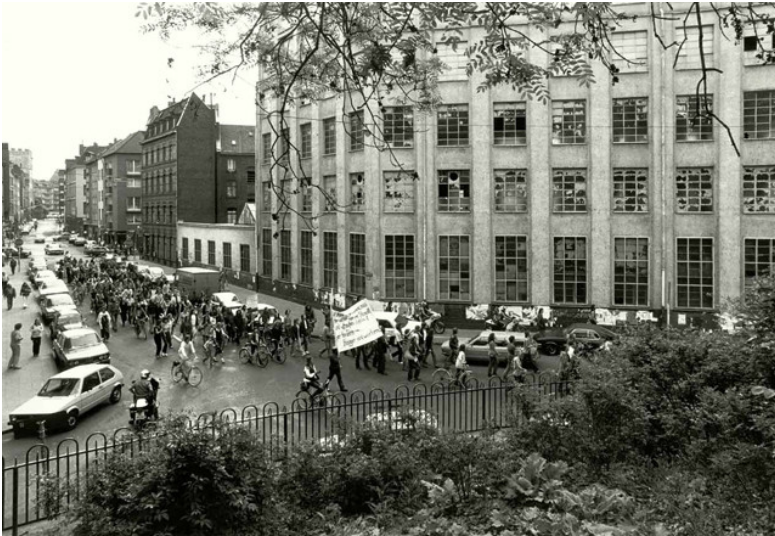
Demonstrationszug am 20. Mai 1980 unmittelbar vor der Besetzung der ehemaligen Stollwerck-Fabrik in der Kölner Südstadt.