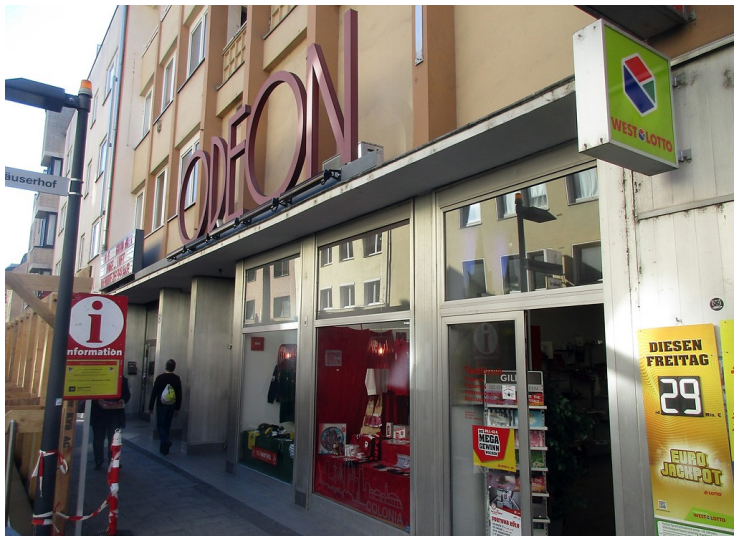
Eingangsbereich des heutigen ODEON-Kinos in der Severinstraße in Köln-Altstadt-Süd (2019).