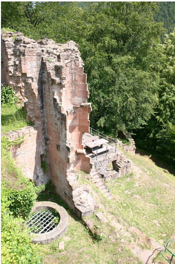
Treppenturm und Zisterne